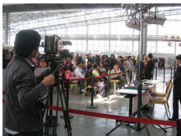
圖：市民興致勃勃的參與分享活動