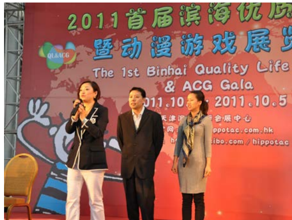
圖：故事主人翁因形象問題尋求專業形象顧問的幫助。