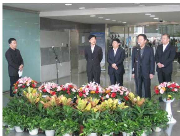
圖：市委、濱海區領導及展會承辦單位總監參加開幕式並致辭